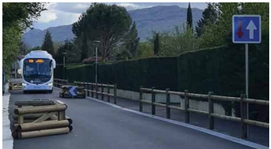
Des « écluses » permettent d'apaiser la circulation dans cet espace partagé.

Le projet de prolongation de la voie douce depuis l'aménagement existant jusqu'au secteur de la gendarmerie est à l'étude sur l'année 2024. Des travaux sont envisagés en 2025.