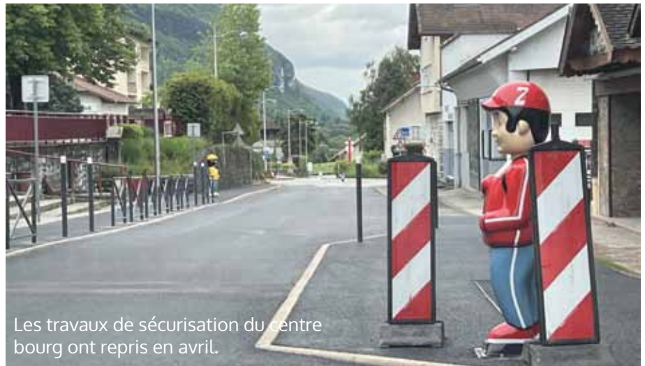
Les travaux de sécurisation du centre bourg ont repris en avril.

► Les travaux d'enfouissement des réseaux secs et la reprise des réseaux humides rues de Vars et de la Tour doivent se