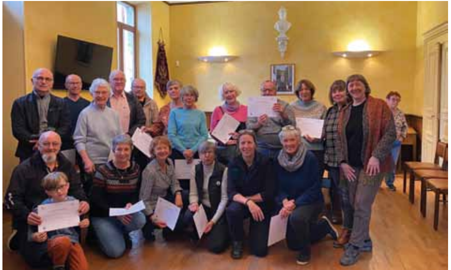
Bravo aux participants de cette première édition de la formation PSC 1.

Fin avril, une cérémonie de remise de diplômes a permis de féliciter tous les participants.