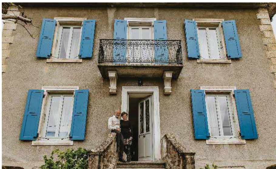
Gilles et Brigitte Cochet ont rénové cette bâtisse pour la transformer en maison d'hôtes.

Entièrement rénovée avec des matériaux aux normes actuelles, la Villa d'Ô renaît dans son style magnifique de la Belle époque. D'une capacité de 15 places maximum, la Villa d'Ô est composée d'une chambre, de deux suites et d'un gîte de 4 à 6 places. Elle accueille des touristes, voyageurs d'affaires et des visiteurs